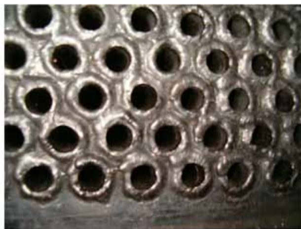
Slika 7: Detalj cevne ploče pri vizuelnom pregledu