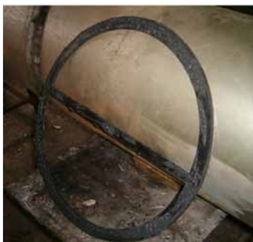
Slika 15: Isečen grafitni zaptivač Teadit GE 1520