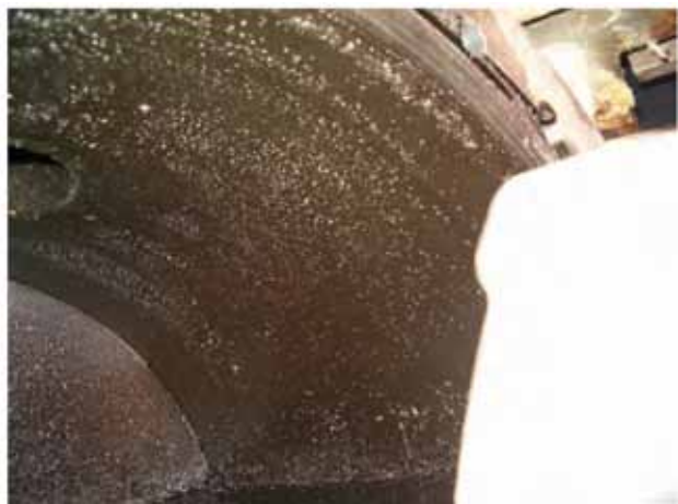
Slika 5: Zaostali metalni opiljci u komori RT

Na slikama br. 4. i 5., prikazano je stanje cevne ploče, posle ceđenja zaostalog ulja i unutrašnjost komore glave sa vidljivim metalnim opiljcima. Glavno pitanje u ovoj fazi je odluka o postupku čišćenja cevi sa unutrašnje strane i pitanje porekla metalnih opiljaka. Pošto nema fiksiranih ili čvrstih naslaga termo ulja, delimično prisustvo koagulanta u ulju nije posledica rada RT već stanja ulja u sistemu, pa zbog toga nema potrebe za čišćenjem i pranjem U cevi, osim ceđenja zaostalog termo ulja i pranja vidljivog dela cevne ploče, radi omogućavanja pregleda spoja cevi i cevne ploče pri hidrostatičkom ispitivanju. Prisustvo metalnih opiljaka u glavi može biti posledica brušenja metalnih delova pri izradi instalacije, koja nije pohvatana u filterima na strani termo ulja (ili filtera uopšte nema) ili posledica dejstva ulja na čelik bilo hemijskim putem ili abrazijom. Prisustvo opiljaka je koncentrisano u komorama, što govori da nema tendenciju povećanja već da se tu našlo taloženjem zbog najmanjih brzina cirkulacije ulja u komorama.