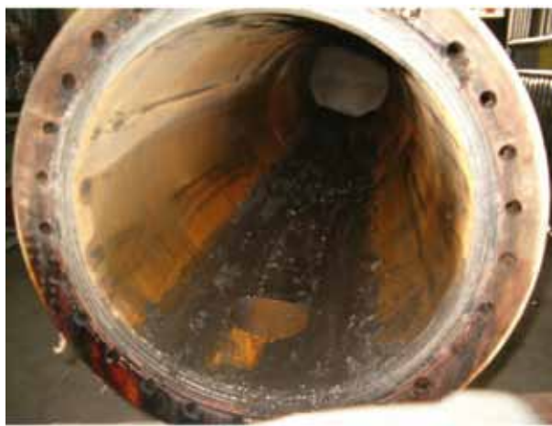
Slika 12: Talog mulja u omotaču RT