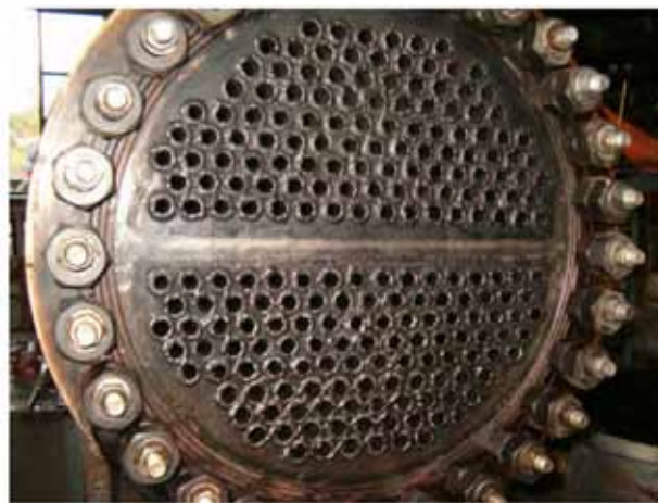
Slika 6: Izgled cevne ploče posle pranja

Standardno ispitivanje izdržljivosti i nepropusnosti sklopova OPP je hidrostatičkim pritiskom vode. Voda je i inače fluid