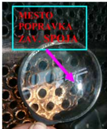
Slika 10: Mesto popravka vara