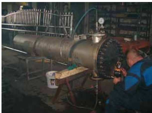
Slika 16: Detaljno kontrolno ispitivanje cevne ploče

Kontrolno ispitivanje spoja cevi i cevne ploče vrši se standardnim postupkom na 9 bar (jer je već izdržao taj pritisak). Kontrolom uz pomoć lupe nije uočeno nikakvo curenje. Radi mogućih skrivenih grešaka i stabilizacije napona, dejstvo pritiska je produženo u naredna 2 sata, pod kontrolisanim vizuelnim nad-