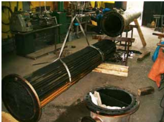
Slika 11: Potpuno demontiran RT 0519: omotač, cevni registar i glava

Vađenje cevnog registra iz omotača kod dobrog dobošastog razmenjivača je uvek skopčano sa teškoćama, jer su tolerancije segmentnih pregrada i omotača male zbog eliminisanja lekažnog strujanja, pa u zavisnosti od vrste i temperatura fluida dolazi do dilatacija cevnog snopa i „zapečenja“ na mestima uske tolerancije dijafragme i segmentnih pregrada sa omotačem. Postupak demontaže je obavljen uz upotrebu specifičnih alata i povećanu pažnju da ne dođe do plastičnih deformacija cevnog registra. Posle potpunog vađenja registra iz omotača, izvršen je detaljni pregled stanja površina razmene cevnog snopa i zaprljanosti na vodenoj strani, videti slike br. 11., 12. i 13.