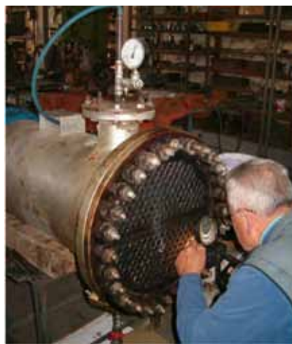
Slika 9: Pregled spojeva lupom