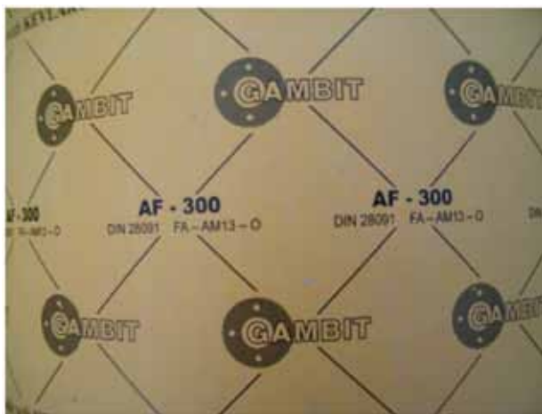
Slika 14: Ploča zaptivača Gambit AF-300