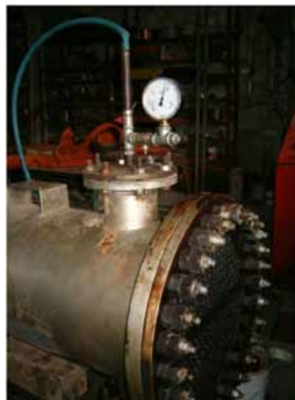
Slika 8: Ispitivanje na 9 bar

Posle sanacije zavarenog spoja, izvršeno je ponovno punjenje vodom, odzračivanje i lagano podizanje pritiska odmah na 9 bar. Pošto u narednih sat vremena vizuelno nije uočeno nikakvo curenje, ispod mogućih mesta curenja postavljen je novinski papir i sistem ostavljen pod pritiskom preko noći u produženom trajanju od 12 sati. Sledeći dan prilikom provere pritiska, uočen je porast pritiska na 9,3 bar, što je posledica porasta temperature vode prema temperaturi okoline. Pristupljeno je završnom pregledu spojeva lupom i dodatnim osvetljenjem svih spojeva od strane dva različita izvršioca. Rezultat je nema - curenja, pritisak stabilan.