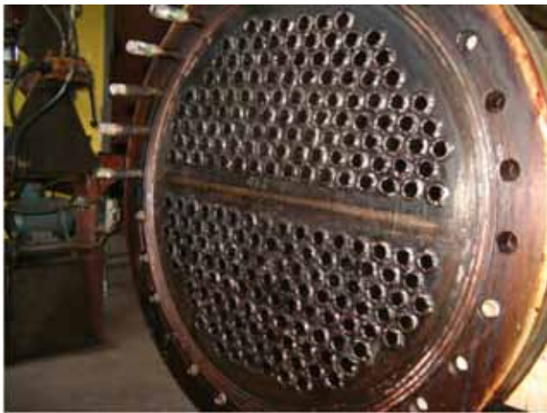
Slika 4: Izgled cevne ploče posle ceđenja termo ulja