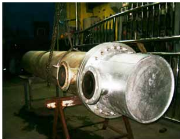
Slika 17: Kompletiran RT posle generalnog servisa

Servis je završen i razmenjivač spreman za isporuku, što se vidi na slici br. 17.