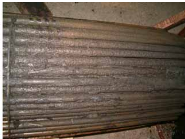
Slika 13: Detalj taloga mulja na cevnom registru

Posle čišćenja površina razmene sa vodene strane, može se pristupiti montaži cevnog registra, pri čemu se obavezno menjaju oba zaptivača na cevnoj ploči. U periodu izrade razmenjivača koristili su se klingerit azbestni materijali za zaptivanje, koji su sada zabranjeni, Pravilnik o ograničenju i zabrani proizvodnje, stavljanja u promet i korišćenja hemikalija (Službeni glasnik RS br 90/2013 – EU direktiva 1999/77/EC od 1.1.2005) pa se mora koristiti neazbestni materijal zaptivača. Prema vrsti, temperaturi i radnom pritisku fluida, izvršen je izbor sledećih materijala za zaptivače.