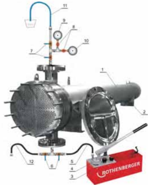
Slika 3: Tipično ispitno postrojenje

i odvod vode pri pražnjenju postrojenja.